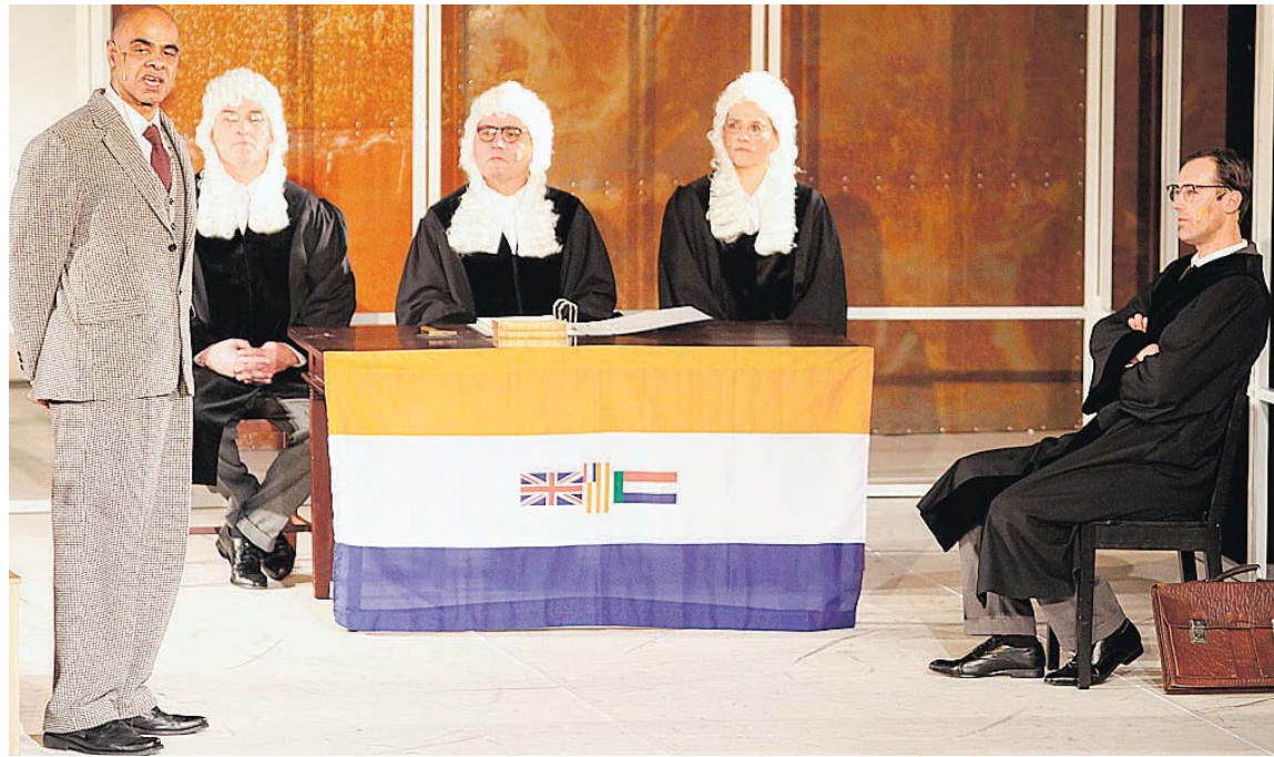
Nelson Mandela (links) muss sich in dieser Spielszene vor Gericht verantworten.

Pünktlich um zwanzig Uhr betraten die fünf Musiker, die vor der Bühne auf Augenhöhe mit den Zuschauern saßen das Parkett. Schon bei der ersten Szene konnte man erahnen, welch tolles Bühnenbild einen während der Vorstellung zu erwarten hat. Immer wieder wurde es passend zu den einzelnen Schauplätzen umgebaut. Zusammen mit den sehr sorgfältig